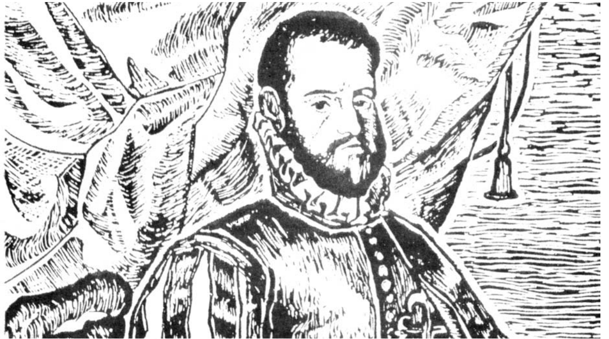
El fundador. Juan Torres de Vera y Aragón.

Constituye así el Acta fundacional un bello documento, patrimonio indiscutido de nuestra historia, que nos permite saber como y cuando fue fundada nuestra ciudad. Comenzarían a correr tiempos difíciles en los que la ciudad se fue consolidando en un territorio hostil, asediado por los naturales que se resistían al establecimiento de los conquistadores españoles, conquistadores que dieron su vida por el solo hecho de legar a sus descendientes el merito de sus servicios prestados.